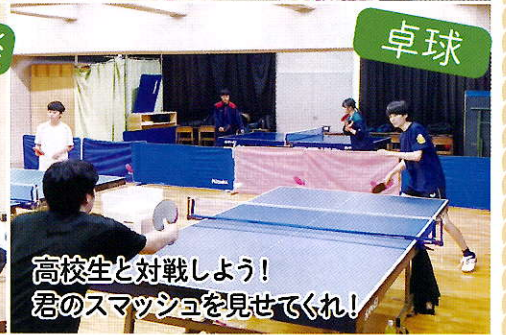
高校生と対戦しよう!君のスマッシュを見せてくれ!