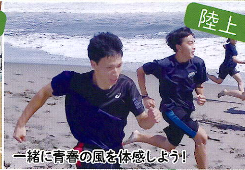
一緒に青春の風を体感しよう!