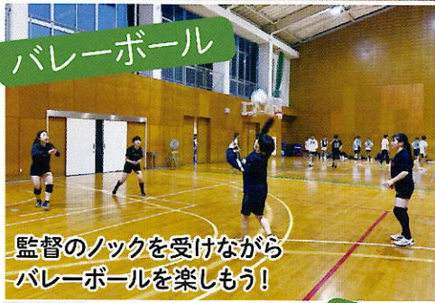
監督のノックを受けながらバレーボールを楽しもう!