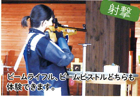
チームライフル、チームピストルどちらも体験できます。