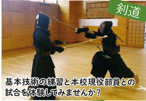
基本技術の練習と本校現役部員との試合を体験してみませんか?