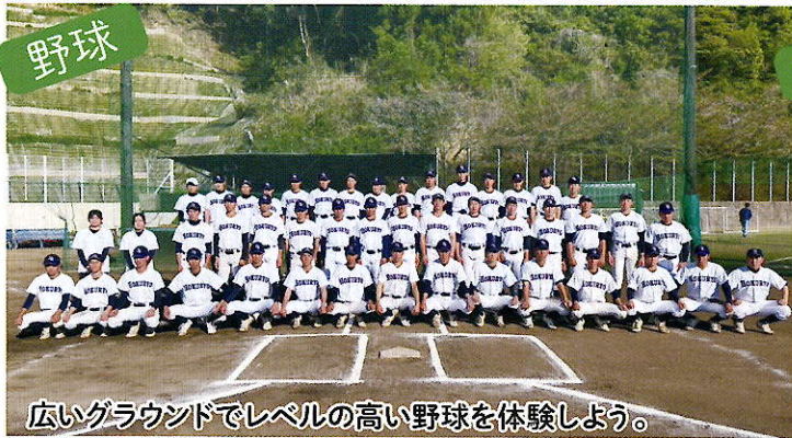
広いグラウンドでレベルの高い野球を体験しよう。

8/31(土) 10/5(土) 11/9(土) 9:00~ 11/23(土) 11:10~