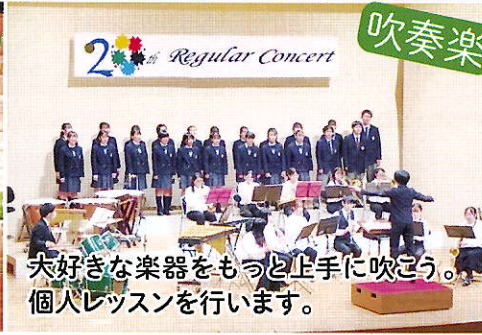
大好きな楽器をもっと上手に吹奏。個人レッスンをを行います。