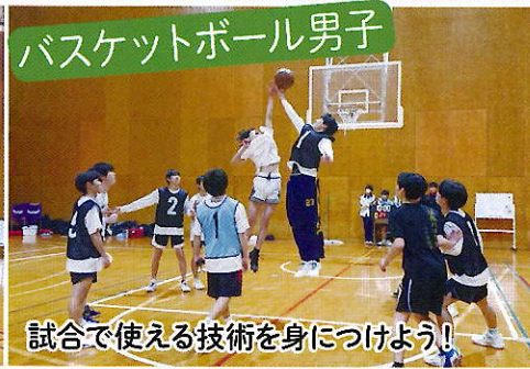
試合で使える技術を身につけよう!