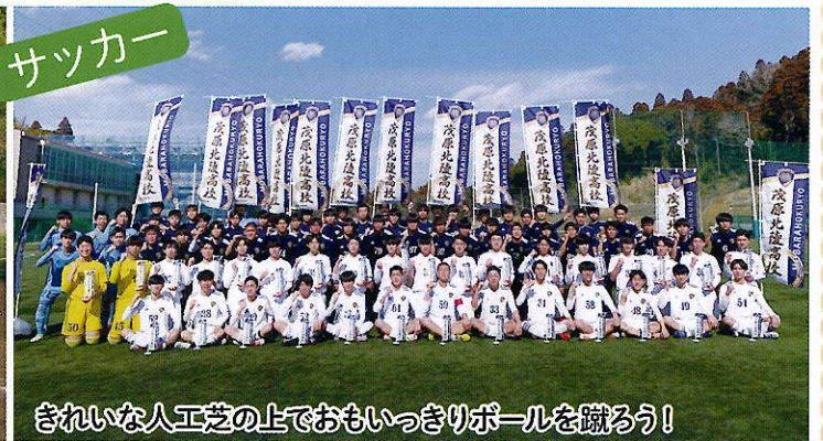
きれいな人工芝の上でおもいきりボールを蹴ろう!