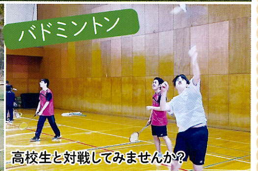
高校生と対戦してみませんか?