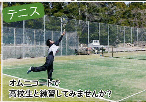
オムニコートで高校生と練習してみませんか?