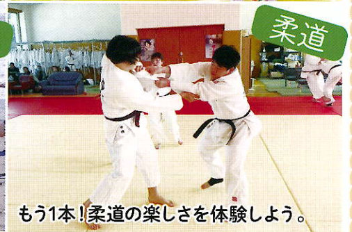
もう1本!柔道の楽しさを体験しよう。