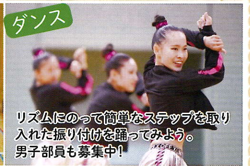
リズムに合わせて簡単なステップを取り入れた振り付けを踊ってみよう。男子部員も募集中!