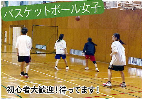
初心者大歓迎!待ってます!